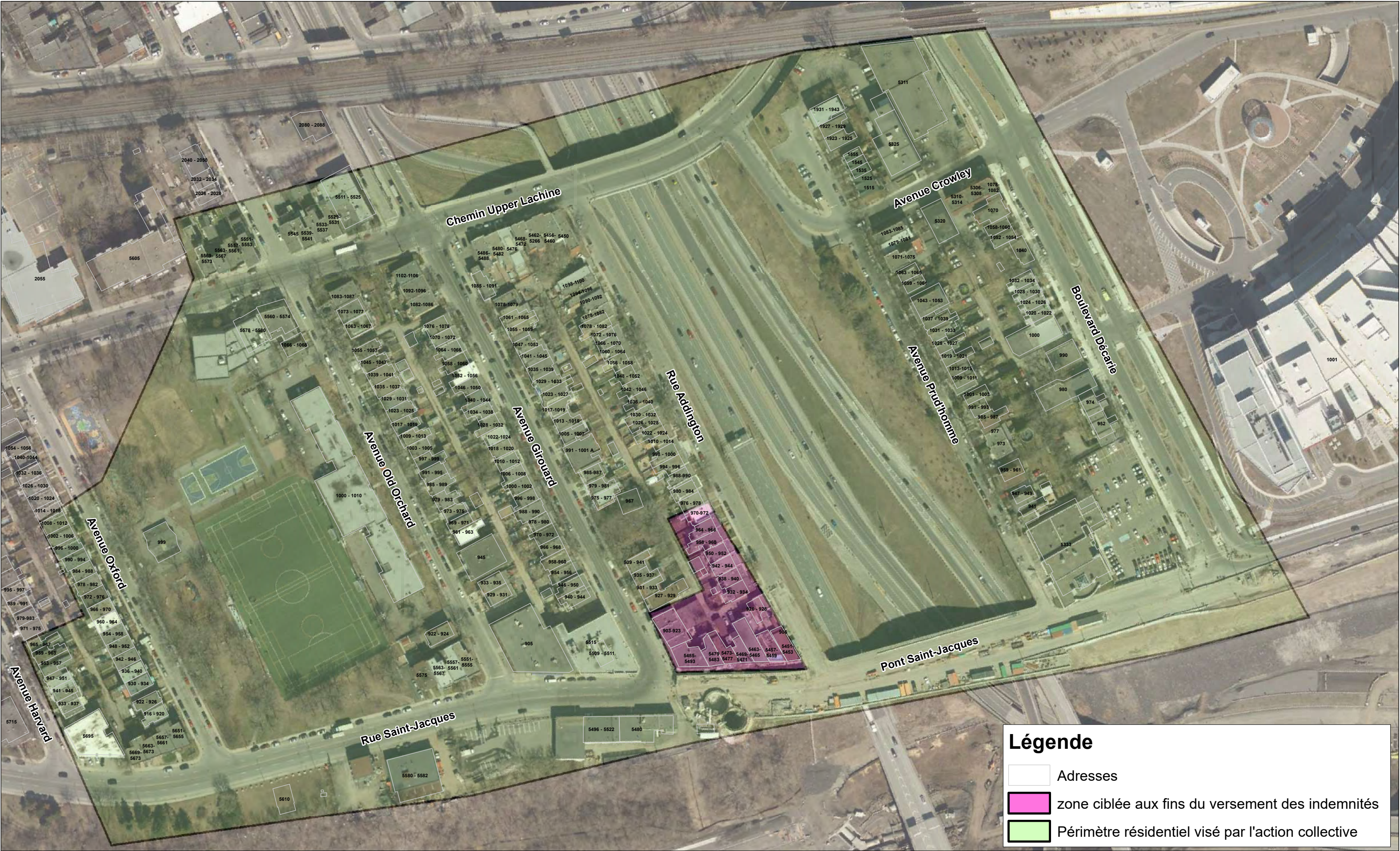
Annexe 1.3: Carte illustrant le périmètre admissible à une indemnité